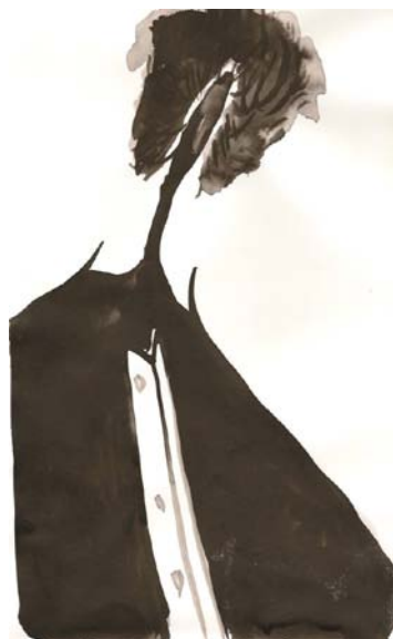
Le sang des filles